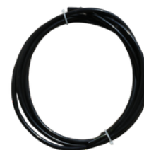
2 copë. Tub uji