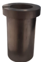
1 copë. Enë grafiti