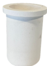
1 copë. Enë qeramike